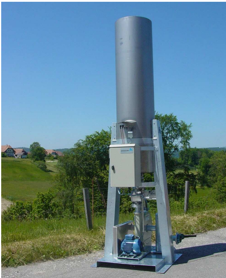
HOFGAS ® - Smarty 300

Sistema de desgasificación móvil y compacto para requerimientos sencillos.